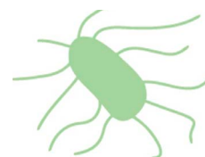
La bactérie salmonelle.

Les salmonelles (bactéries présentes dans le tube digestif de l'homme et des animaux ainsi que dans la terre). Leur présence en quantité élevée dénonce :