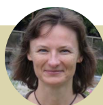
Laurence J.-L. B.

Une question ? Blog des Experts 'Hygiène en fiches pratiques' sur www.lhotellerie-restauration.fr