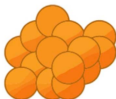
La bactérie staphylocoque.